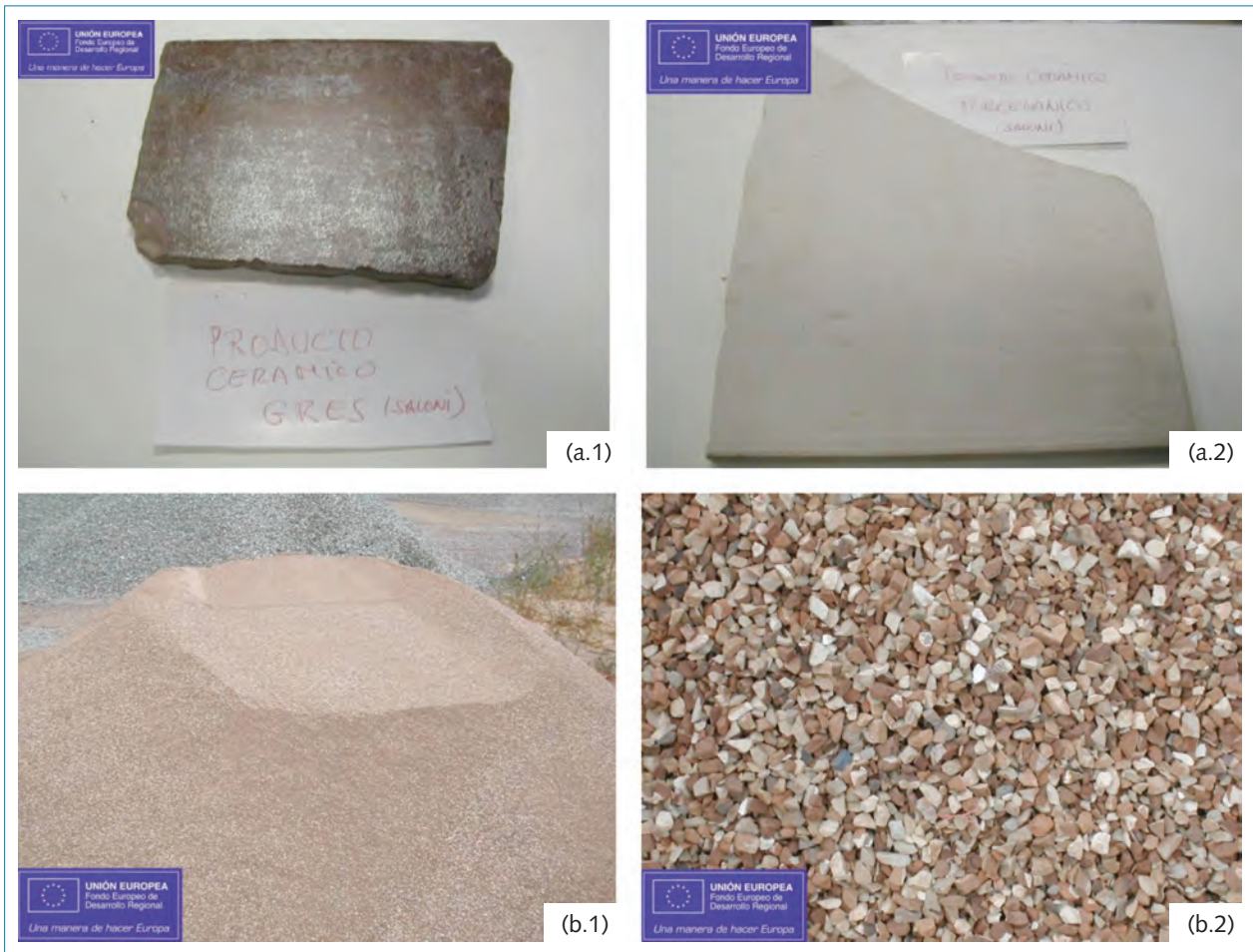
Figura 2. (a) Residuo cerámico: a.1) Tipo gres, a.2) Tipo porcelánico; (b). Árido cerámico tratado: b.1) Fracción fina 0-4 mm, b.2) Fracción gruesa 4-11 mm

El tramo experimental fue ejecutado en abril de 2010 en la carretera CV-170, en las proximidades a la población de Atzeneta, tratándose de un tramo con una intensidad media diaria de vehículos muy baja, contando con una sección de calzada de aproximadamente 6,30 m de anchura, de doble sentido y sin arcenes.