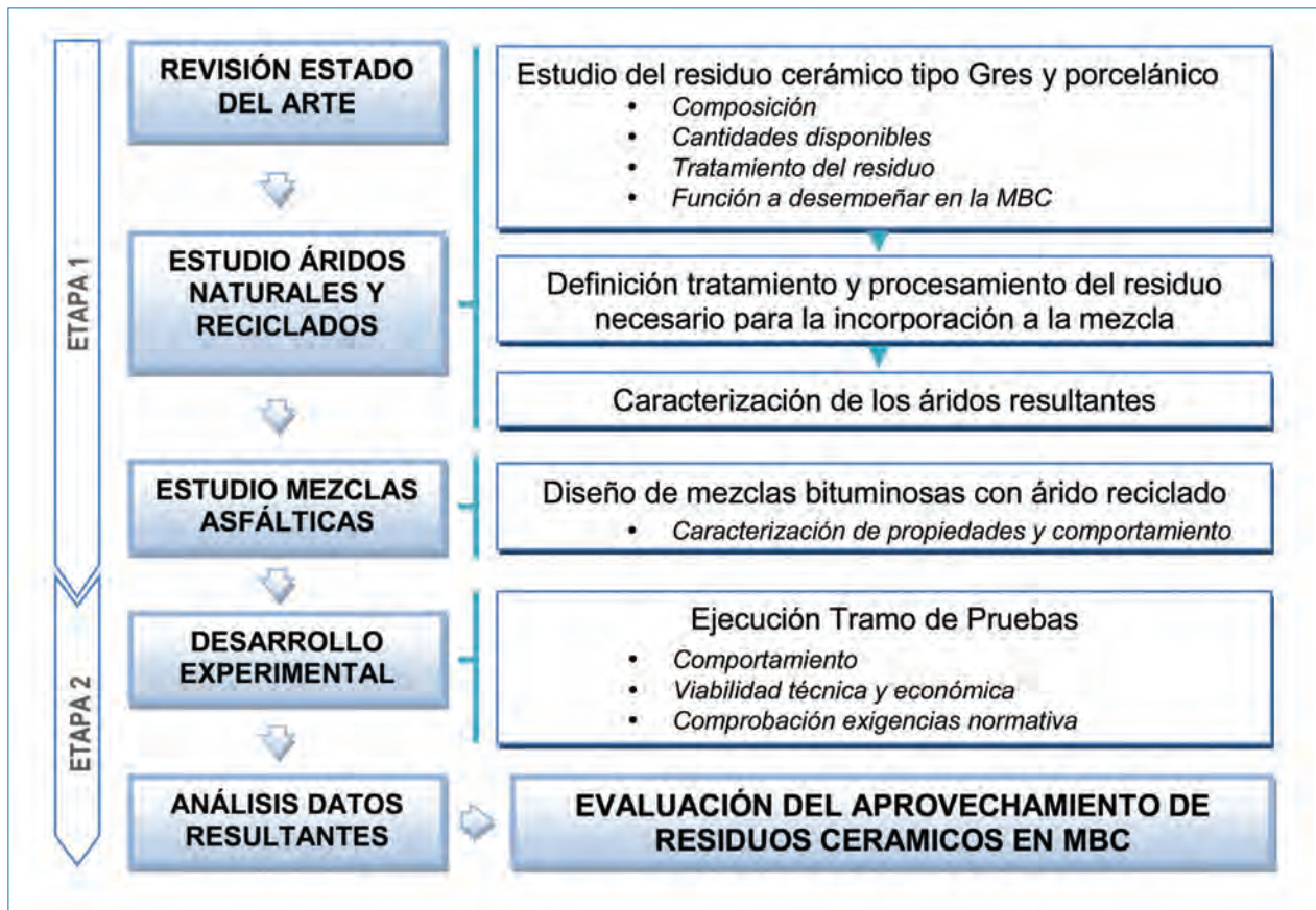
Figura 1. Esquema metodológico del estudio del aprovechamiento de residuos cerámicos en mezclas bituminosas en caliente.