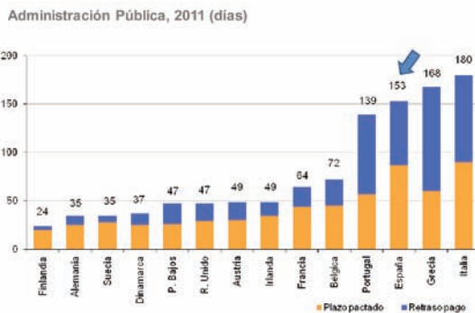
Figura 2: Plazos de pago de las administraciones públicas según países.