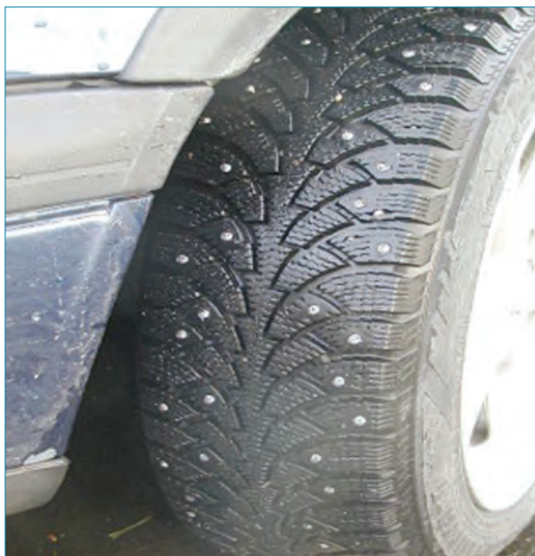
Figura 1: Aspecto de un neumático con clavos.

la norma EN 13108-1, que corresponden a las antiguamente denominadas mezclas tipo D, S y G; las mezclas BBTM, descritas en la norma EN 13108-2, que corresponden a las conocidas como M y F aplicadas para rodadura en capa fina; y, por último, las que se denominan Porous Asphalt (PA), descritas en la norma EN 13108-7, y que corresponden a las denominadas como mezclas drenantes, cuya característica principal es poseer un elevado porcentaje de huecos.