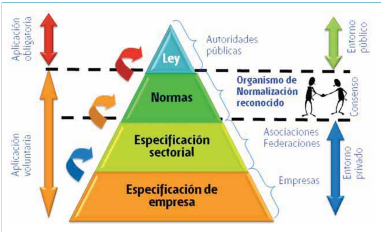
Figura 1. Relación entre especificaciones privadas, normas y legislación.

En ocasiones se produce confusión entre el carácter voluntario de la norma y su aplicación "obligatoria" en determinados casos, determinada por el Legislador. Un ejemplo serían las normas armonizadas bajo el Reglamento de productos de construcción (es decir aquellas que sirven de base para el marcado CE que llevan, por ejemplo, las mezclas bituminosas) o aquellas citadas en el Pliego de Prescripciones Técnicas Generales para Obras de Carreteras y Puentes (PG-3).