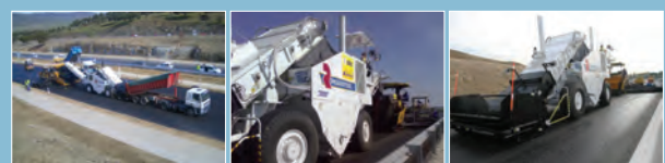
Imágenes de silos móviles de transferencia.