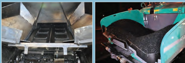
Tolva de recepción de la mezcla y sistema de alimentación a la regla de extendido.