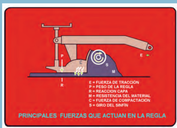
Esquema de la regla de extendido.

Esta última debe entenderse como un elemento flotante remolcado por la parte tractora y conectado a ella en los puntos de arrastre. La regla dispone de diversos sistemas que, junto con su peso propio, colaboran en la precompactación de la mezcla y que están basados en un tãmpor simple o doble a la entrada de la misma, así como en el uso de vibradores de superficie. Se equipan con un sistema de calefacción para evitar el arrastre de material por parte de la regla y su anchura puede ser fija o variable. La sección transversal de la regla puede modificarse al estar articulada en su parte central. Un tornillo de ajuste permite regular su posición y una escala indica el valor de bombeo alcanzado.