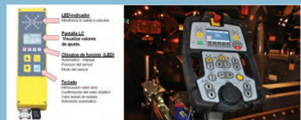
Distintos tipos de sensores digitales.