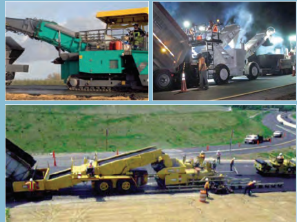
Imágenes de distintos tipos de tr nsfer.

Los dispositivos de transferencia que existen actualmente en el mercado español se pueden clasificar en dos grandes grupos: