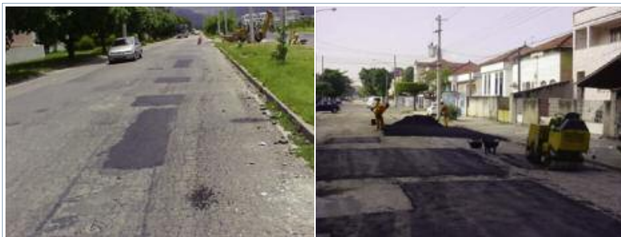
Fotos de Vias com Restaurações tipo Tapa-Buracos.

As atividades de recuperação e manutenção dos pavimentos requerem um planejamento detalhado das ações viárias e também um diagnóstico com embasamento técnico, de forma a garantir a racionalização e a otimização dos recursos públicos, bem como a durabilidade dos serviços e o elevado padrão de rolamento dos pavimentos. As consequências da falta de planejamento e de um criterioso diagnóstico dos pavimentos estão associadas às operações