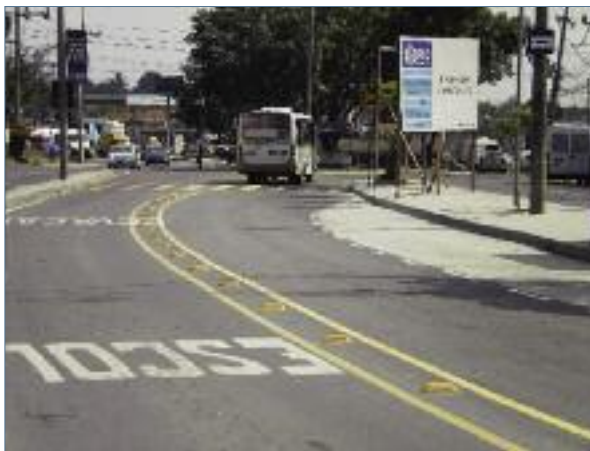
Fotos durante a execução e após conclusão.

Várias vias restauradas já apresentam 7 anos em serviço, em bom estado superficial do pavimento, revelando uma economia fantástica. Também se preocupou em desenvolver um programa de gestão de pavimento, de maneira a permitir a administração pública intervir no momento certo com o menor custo possível.