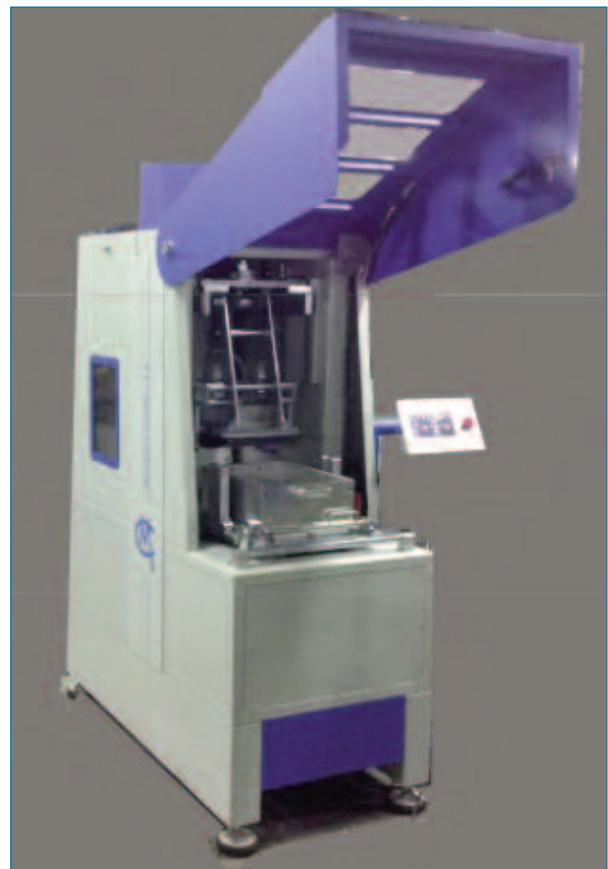
Foto 2. Compactador de segmento.