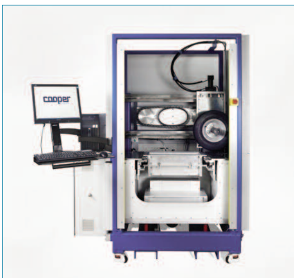
Foto 1. Compactador de rueda neumática.

La norma permite la utilización de 3 métodos diferentes: compactación con un equipo con una o dos ruedas con neumático, utilizando un rodillo de acero (permite 3 procedimientos distintos) o empleando un compactador de segmento. En esta ficha nos fijaremos en el compactador de segmento que es el más utilizado en España.